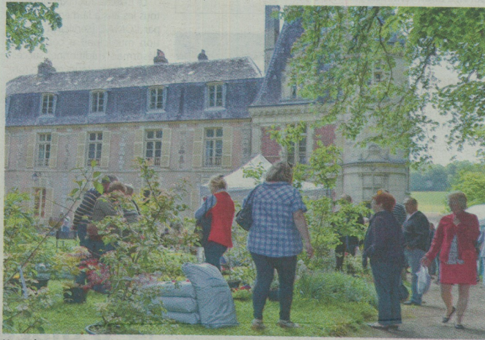
Un cadre exceptionnel pour une manifestation qui ne demande qu'à se développer.