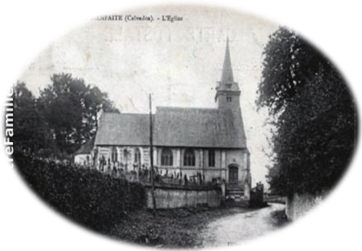
SAINT-FAITE (Calvados) - L'Eglise