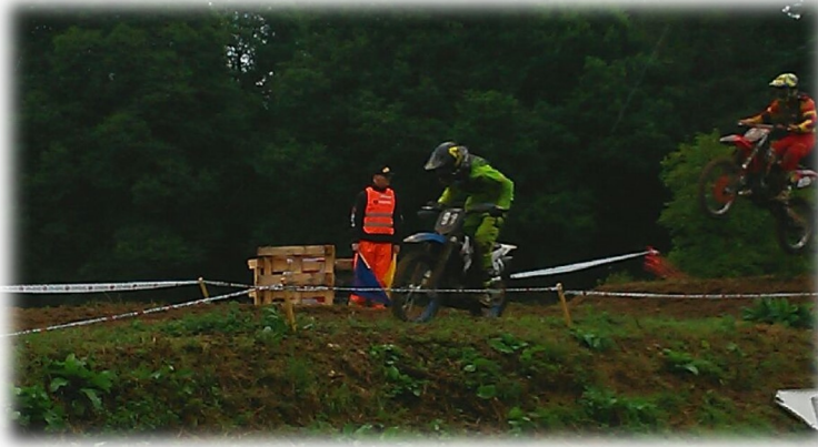
Course de motocross à St Martin de Bienfaite La Cressonnière

Rassemblement devant la mairie d'Orbec au son de la sirène des pompiers puis des cloches de l'église Notre-Dame. Le maire a accueilli de nombreux autres élus des communes voisines et dédié ces instants de recueillement « en mémoire des victimes de la barbarie et de l'ignominie ». Dans la foule, un anonyme, qui se veut « la voix de la race humaine » a appelé « à l'union et à la dignité face à l'abomination ». Les personnes qui commençaient à se disperser l'ont alors entouré pour l'applaudir chaleureusement.