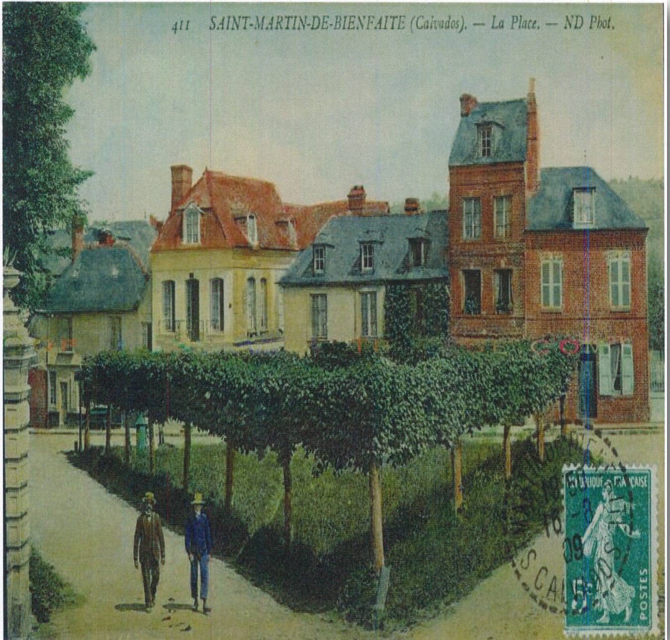
411 SAINT-MARTIN-DE-BIENFAITE (Cairados). — La Place.